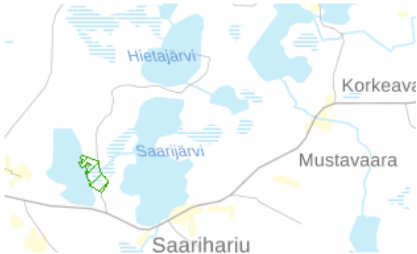
Kuva: Ranta-asemakaava-alueen sijoittuminen.